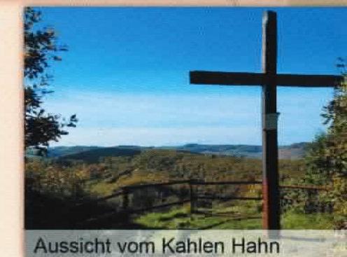
Aussicht vom Kahlen Hahn