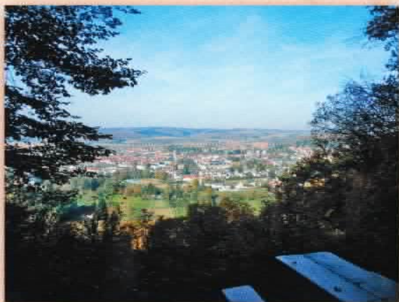
Aussicht vom Tempelchen

Der Hottenbachweg (rechts!) führt zum Tempelchen mit einer wunderbaren Aussicht über Bad Sobornheim.