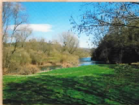
Wegstück entlang der Nahe

Dieser Flyer wurde erstellt und herausgegeben durch den Wegpaten SPD-Stadtverband Bad Sobernheim und mit freundlicher Unterstützung von Herbert Weber, Bad Sobernheim